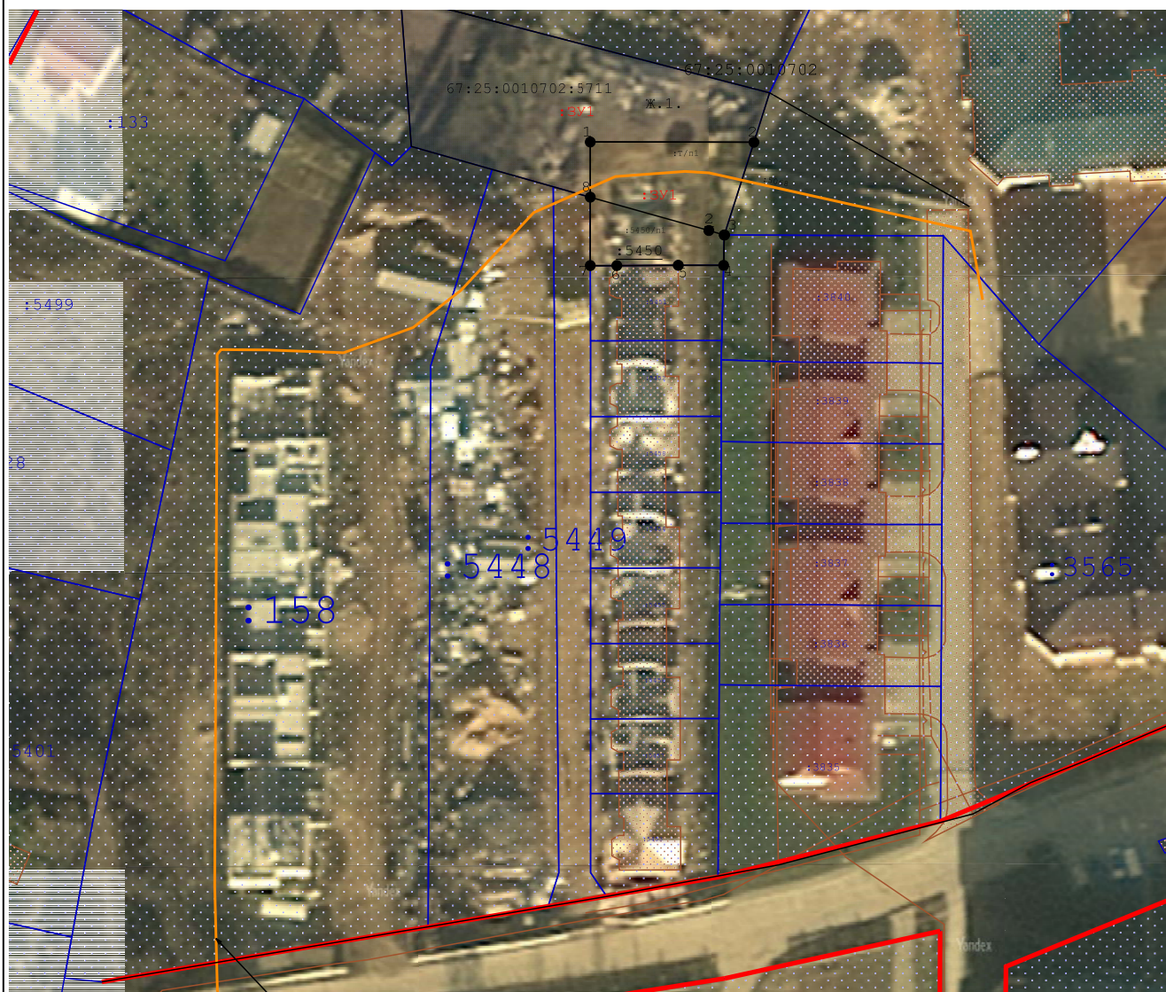
Схема расположения земельных участков