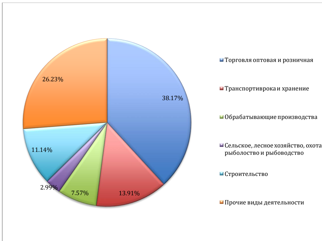
Структура малого и среднего предпринимательства в муниципальном образовании «Ярцевский муниципальный округ» Смоленской области по видам деятельности